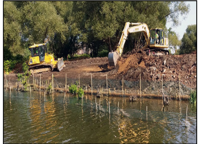
Travaux en cours sur le site du projet Toe of Katherine Street Peninsula, un projet de restauration de l'habitat dans le secteur préoccupant de la rivière Buffalo.